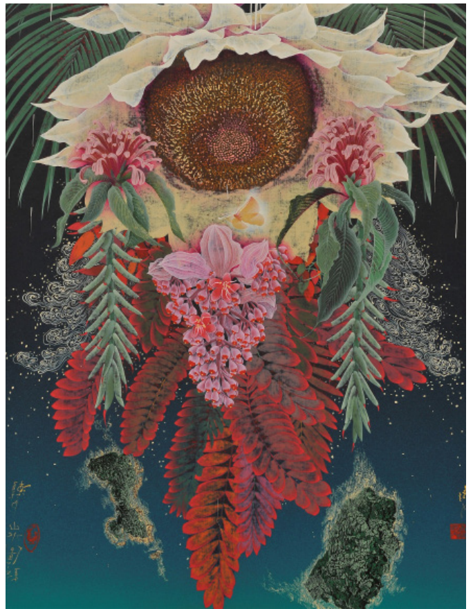
Paysage de Seto, 92 x 73 cm