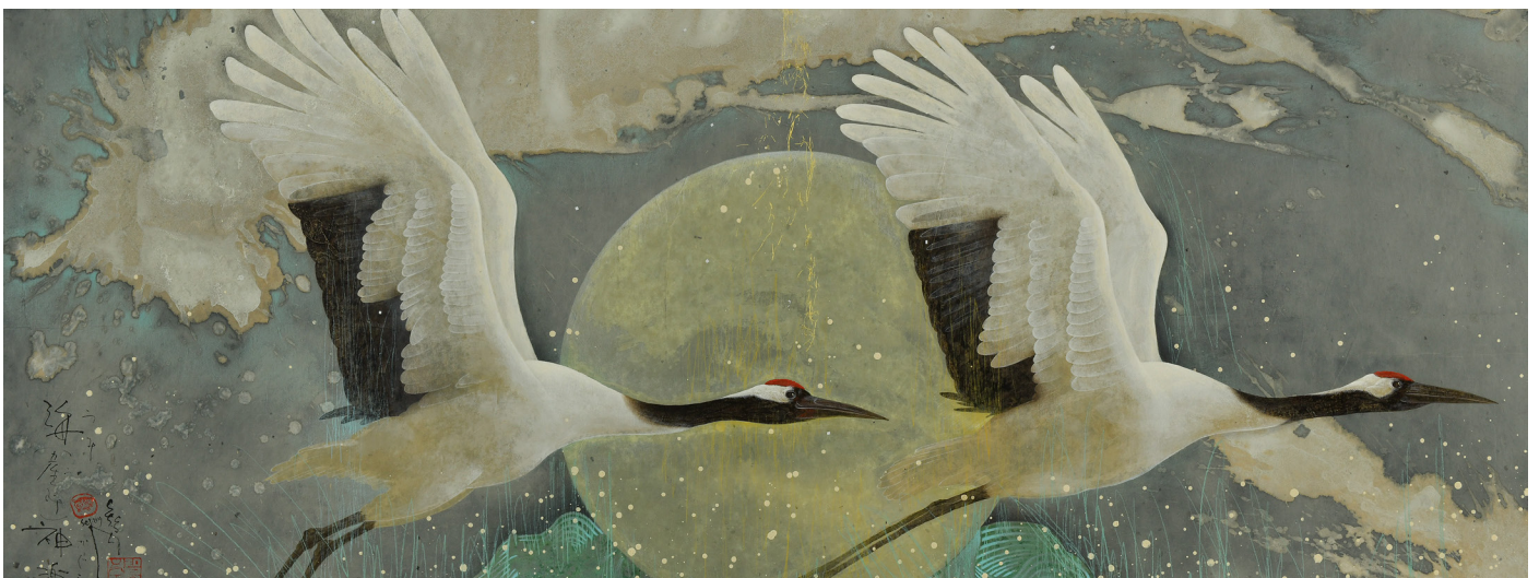
Envol sur les flots, 90 x 180 cm