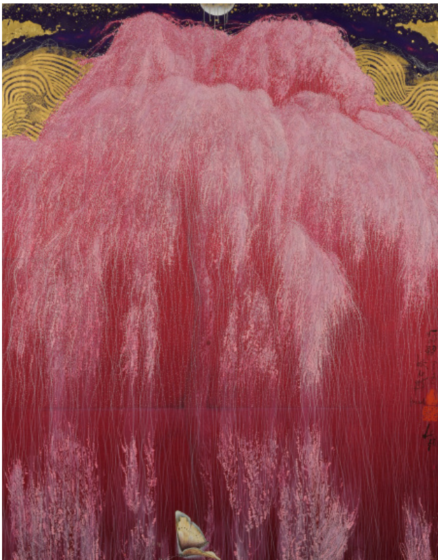
Cerisier sous lumière divine, 92 x 73 cm