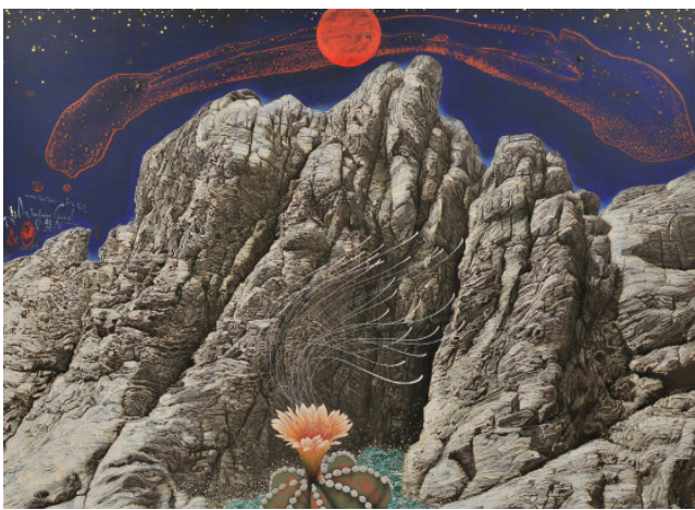
Rocher céleste, 89 x 116 cm