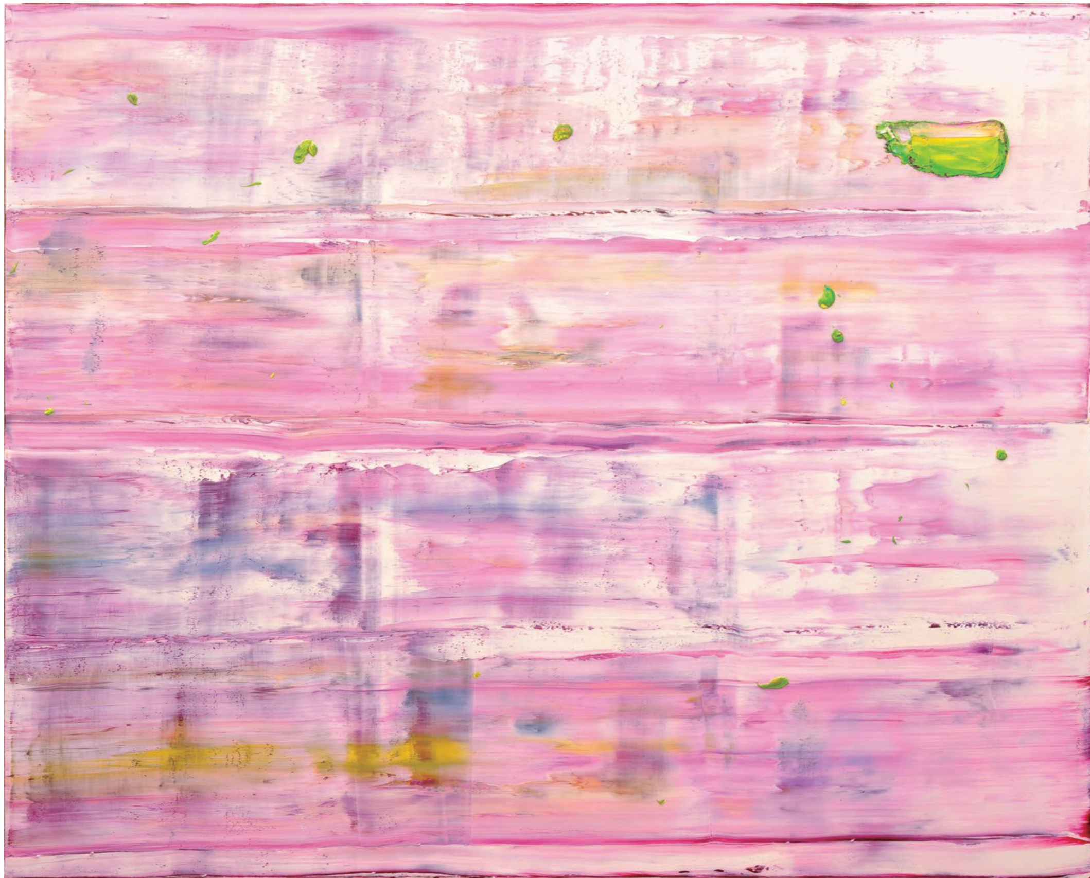
花筏 Flower Raft 182×228cm