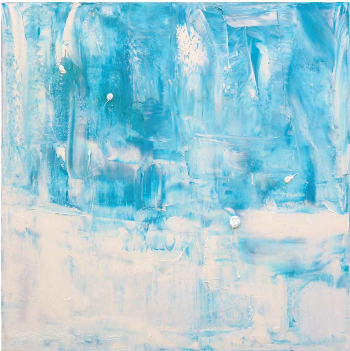
白い朝 White morning 92×92cm