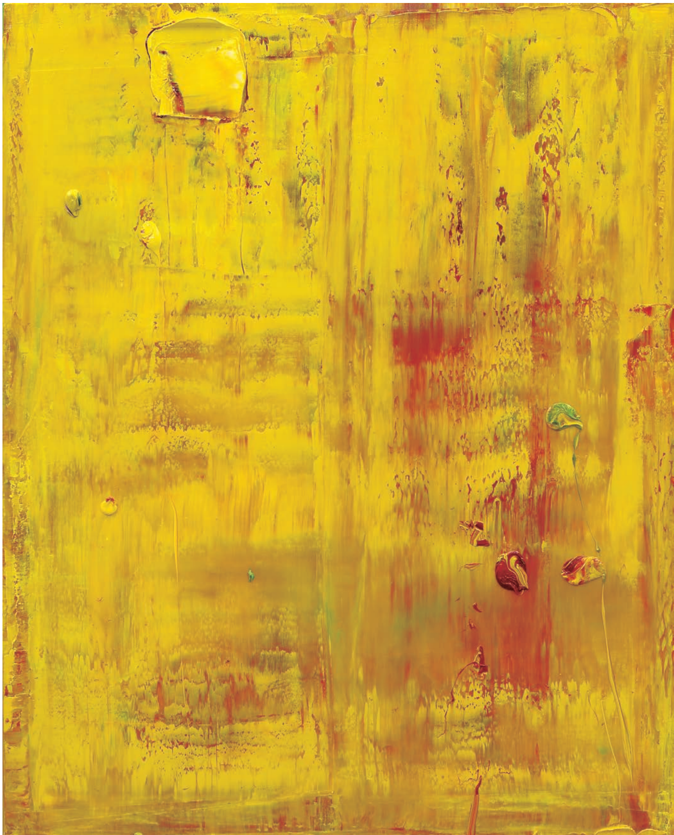
秋色 Autumn Colors 100×81cm